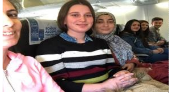
Çek Cumhuriyeti Uçak Seyahatimiz