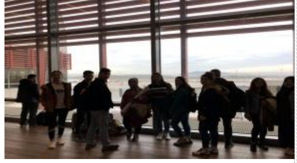
Sabiha Gökçen Havaalanı